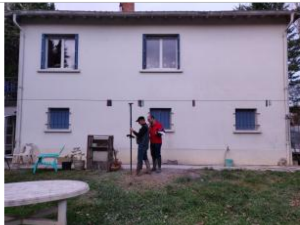
Maison lieu dit de la Bouhere