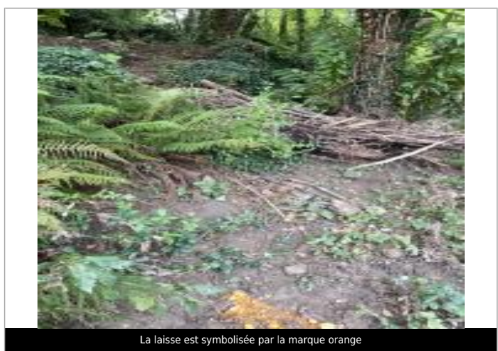
La laisse est symbolisée par la marque orange

SOURCE DE REPÉRAGE : RELEVÉ POST-CRUE DU 15-16 DÉCEMBRE 2019 SUR LA GARONNE AGENAISE SPC GTL (820470) - 19/12/2019 Type de repérage : Campagne de terrain post-inondation Organisme(s) : SPC Garonne - Tarn - Lot