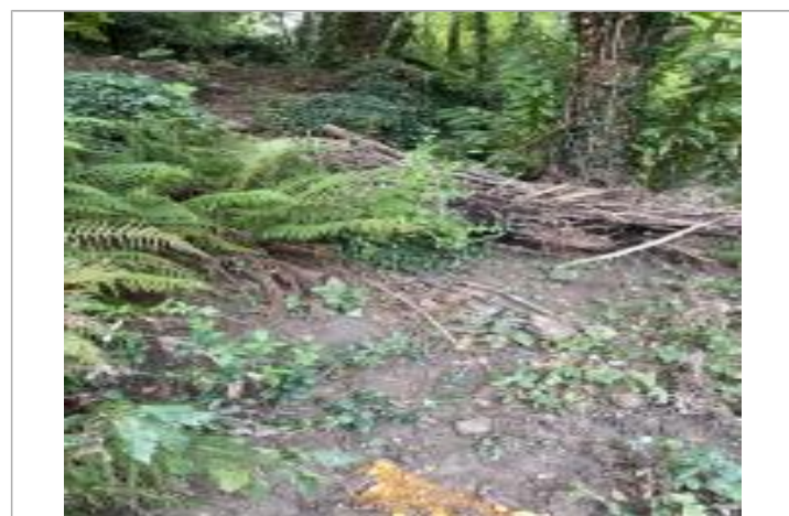
La laisse est symbolisée par la marque orange