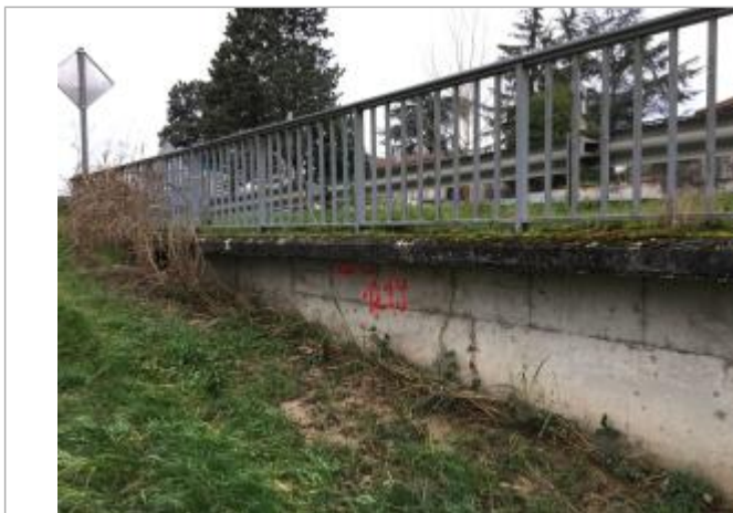
Vue de la marque de laisse de crue