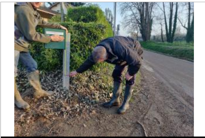
Poteau en acier galvanisé maintenant la boîte au lettre

GÉOLOCALISATION Coordonnées WGS84 : X: 0.22503170 / Y: 44.41341700 Coordonnées RGF93 (Lambert 93) X: 479089.97 / Y: 6372145.88 Coordonnées RGF93 (ETRS89) : X: 0.2250317 / Y: 44.413417 Code Hydro: O--0000 Rive de référence: