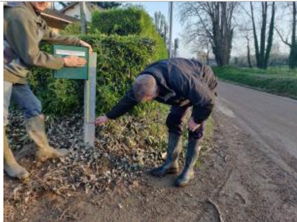
Poteau en acier galvanisé maintenant la boîte au lettre