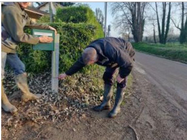
Laisse sur poteau en acier galvanisé maintenant la boîte au lettre

Type de repérage : Campagne de terrain post-inondation