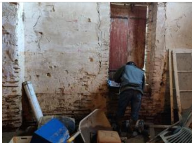
Intérieur ancienne métairie (accès porte à droite de la façade principale) avec repère des crues du 16/12/2019 à 72cm du sol , de 1981 à 1.52m du sol et de 1953 à 2.10m du so

Type de repérage : Campagne de terrain post-inondation