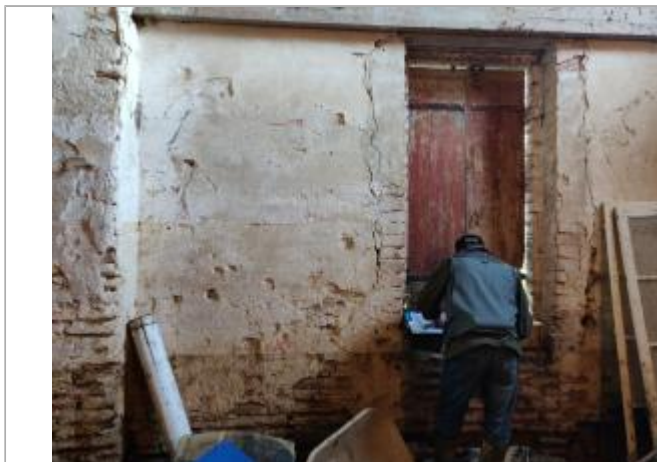
Photo de l'intérieur de la métairie (accès par la porte à droite de la façade principale) avec repère des crues au stylo rouge du 16/12/2019, de 1981 et de 1953 .