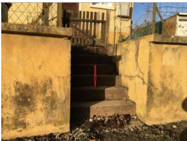
L'eau a atteint le niveau de la deuxième marche soit environ 45 cm au dessus du seuil

Type de repérage : Campagne de terrain post-inondation