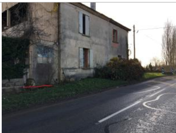
La laisse est symbolisée par le trait rouge

Type de repérage : Campagne de terrain post-inondation