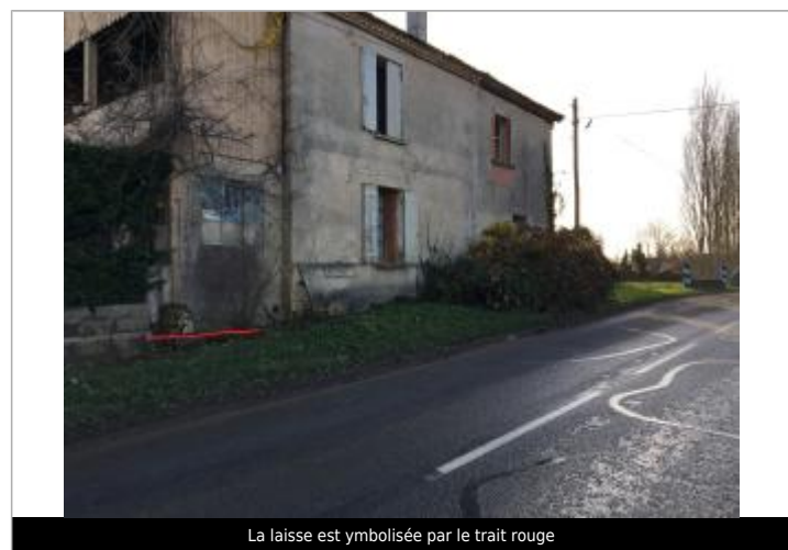
La laisse est symbolisée par le trait rouge