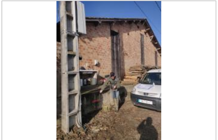
Maison - Ferme brique rouge lieu dit Bouronne