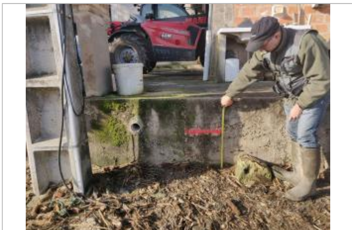
Marque sur muret à 38cm du sol

MARQUE Maximum de l'inondation : Oui Visibilité : Non État du repère : Disparu