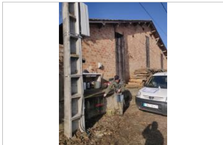
Maison - Ferme brique rouge lieu dit Bouronne

GÉOLOCALISATION Coordonnées WGS84 : X: 0.08644800 / Y: 44.51217900 Coordonnées RGF93 (Lambert 93) X: 468467.19 / Y: 6383506.9 Coordonnées RGF93 (ETRS89) : X: 0.086448 / Y: 44.512179 Code Hydro: O--0000 Rive de référence: