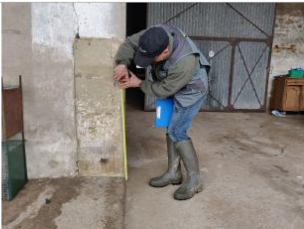
Repère (ancienne trace) du maximum de la crue de 1981 sur mur en pierre du préau de la ferme