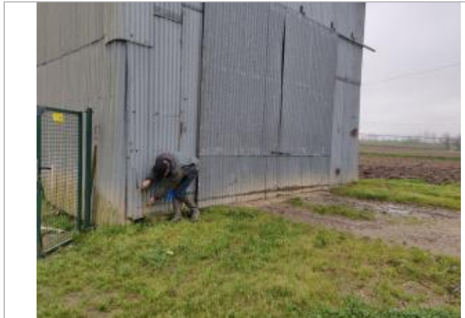
Hangar (métallique) lieu dit Perixou n°1