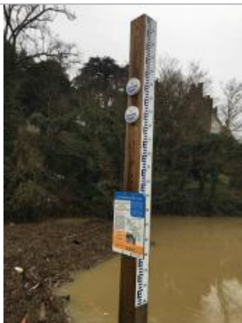
Vue de la marque laissée par la crue