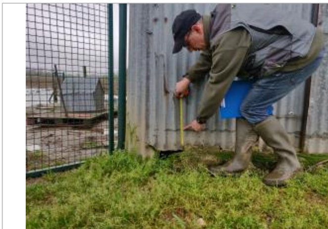
Vue de la laisse à 15 cm du sol sur façade principale coté gauche