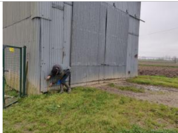
Hangar (métallique) lieu dit Perixou n°1