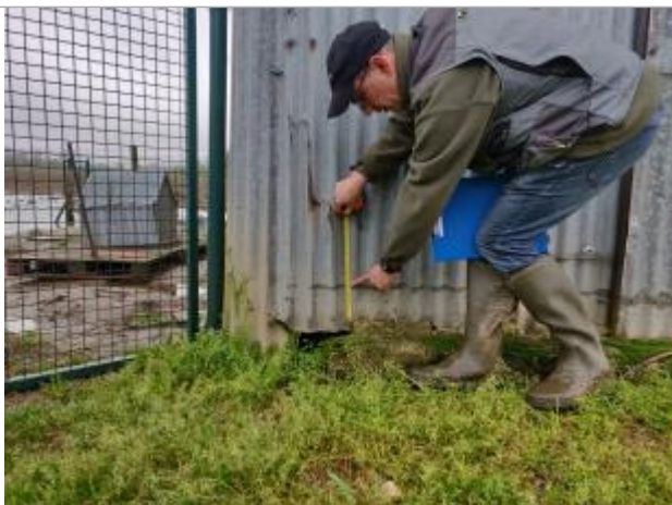
Vue de la laisse à 15 cm du sol sur façade principale coté gauche