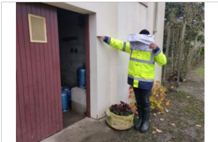
Laisse dans garage maison de 1981 lieu dit Lescure