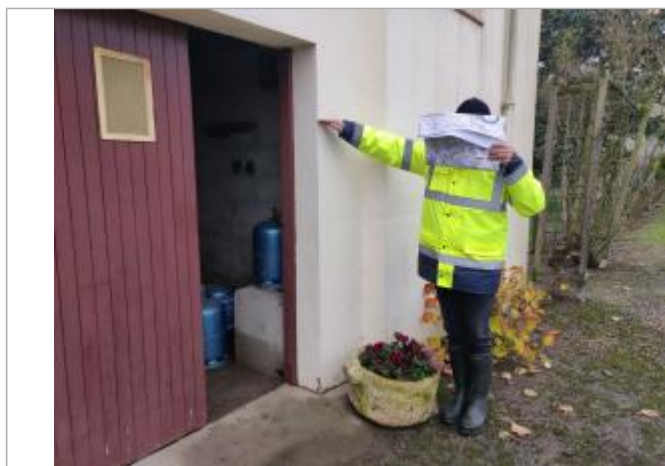
Laisse dans garage maison de 1981 lieu dit Lescure