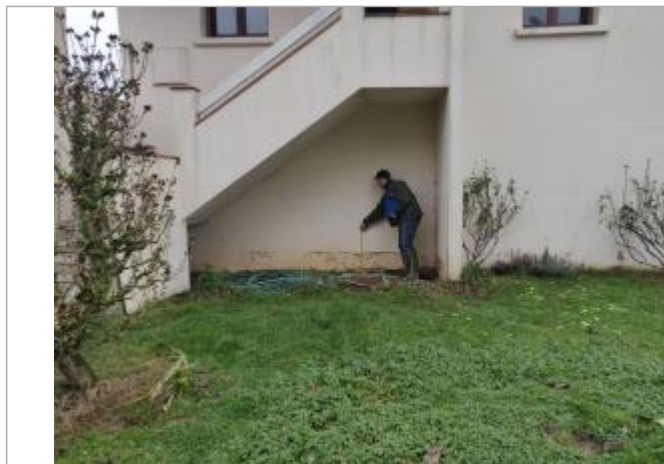
Repère sur maison

SOURCE DE REPÉRAGE : RELEVÉ POST-CRUE DU 16 DÉCEMBRE 2019 SUR LA GARONNE MARMANDAISE SPC GTL - 06/01/2020