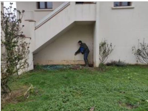
Repère sur maison

Type de repérage : Campagne de terrain post-inondation