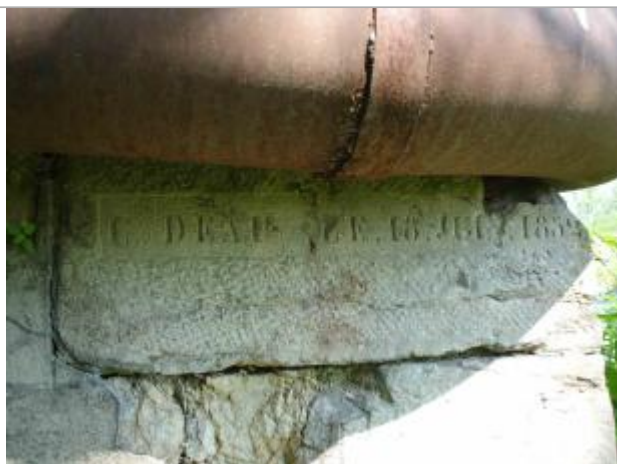
Photo du repère de crue

Altitude calculée de l'eau (en m) : 118.19