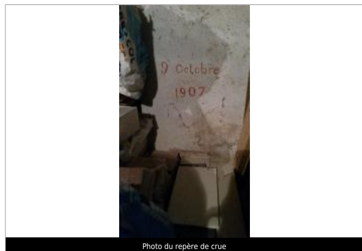
Photo du repère de crue

MARQUE Texte : 9 octobre 1907 Maximum de l'inondation : Non Visibilité : Non