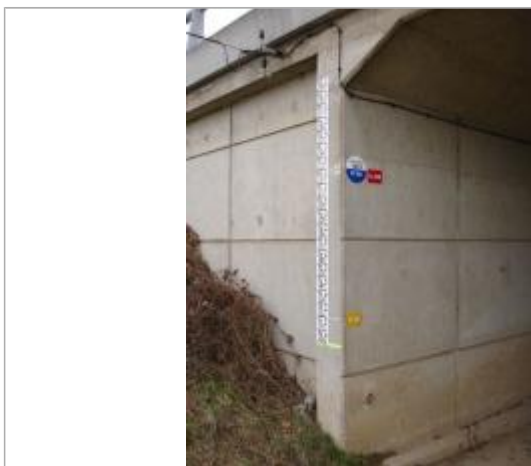
Photo du repère de crue