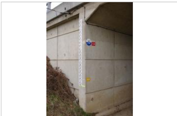
Photo du repère de crue