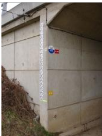
Photo du repère de crue

Altitude calculée de l'eau (en m) : 176.2