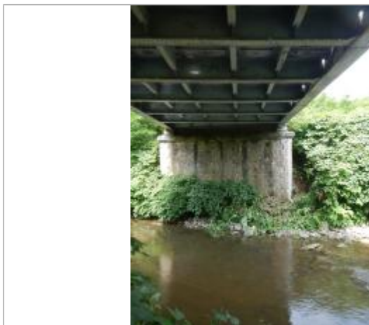
Echelle limnimétrique sur la culée en aval du pont (rive gauche)