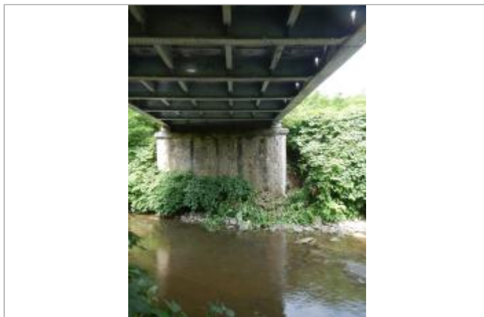
Echelle limnimétrique sur la culée en aval du pont (rive gauche)