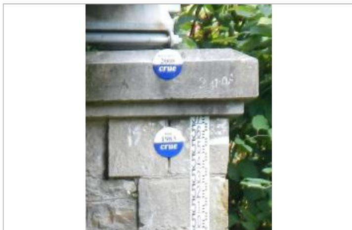
Repère de la crue de 2008 (le plus haut)