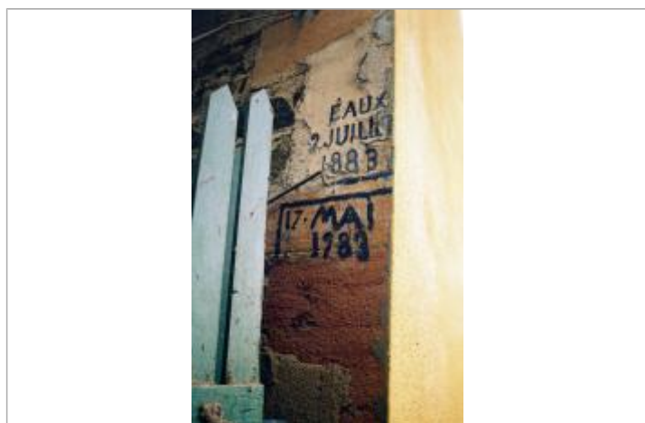
Photo du repère de crue