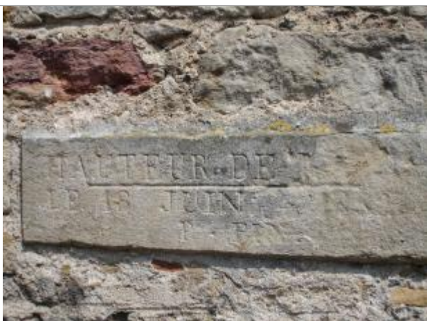
Photo du repère de crue

Altitude calculée de l'eau (en m) : 195.88