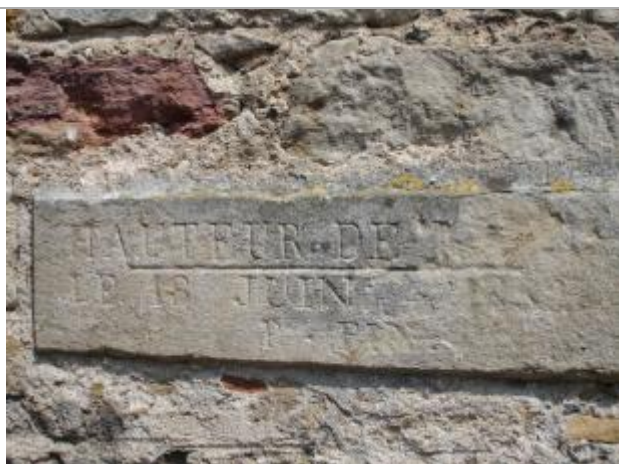
Photo du repère de crue