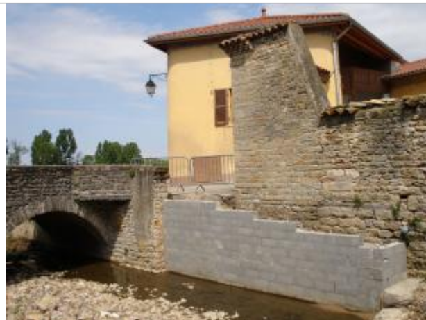
Site sur façade en pierres anciennes (amont du pont et rive droite)

Coordonnées RGF93 (ETRS89) : X: 4.712675 / Y: 45.8608071