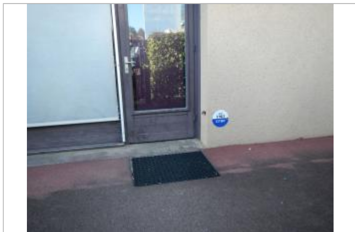
Photo du repère de crue