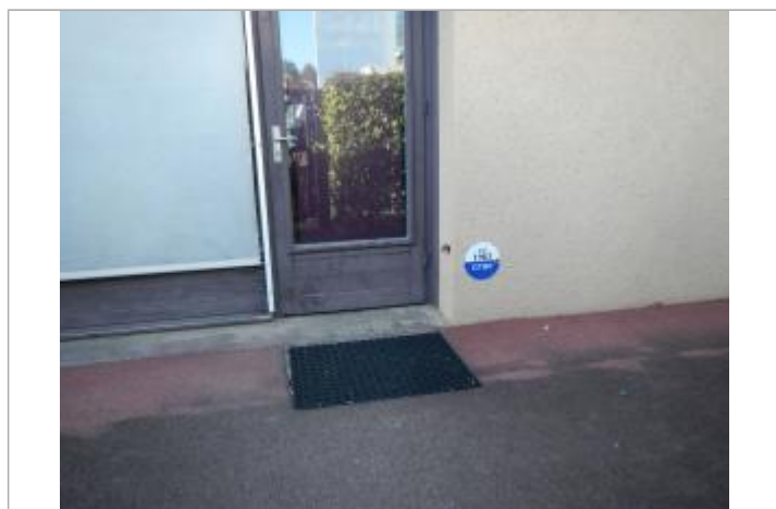
Photo du repère de crue

Texte : mai 1983 - crue Maximum de l'inondation : Oui Visibilité : Oui