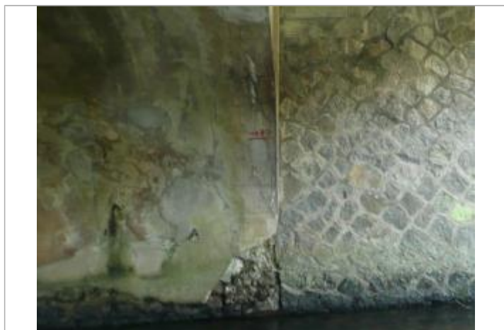
Photo de la marque de peinture