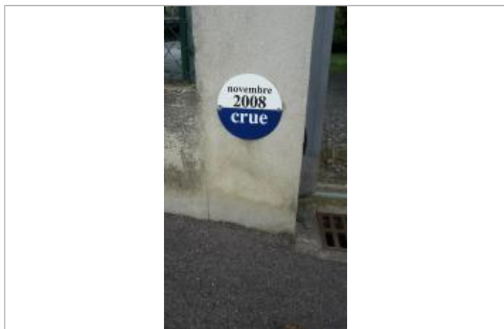
Photo du repère de crue