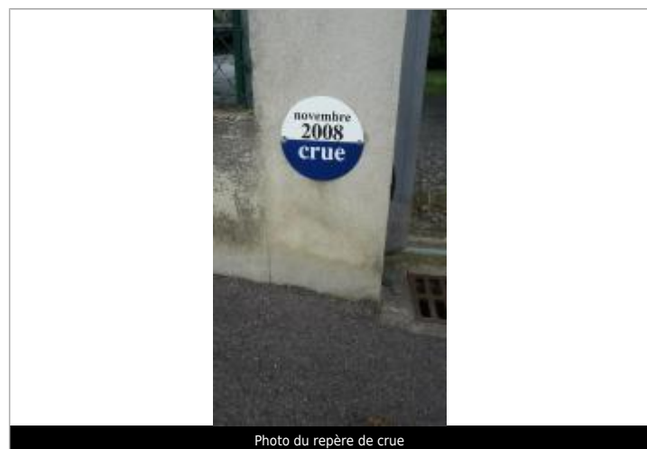
Photo du repère de crue

GÉNÉRAL Code : WEB_R_201912133636 Date de mise à jour : Auteur : Syndicat Mixte du Bassin Versant de l'Azergues 02/07/2020