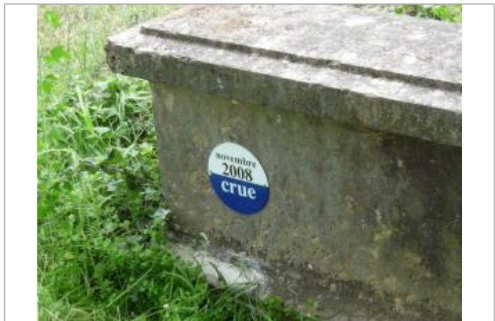
Photo du repère de crue

MARQUE Texte : novembre 2008 - crue Maximum de l'inondation : Oui Visibilité : Oui