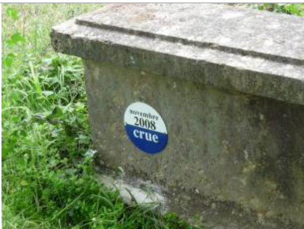
Photo du repère de crue

Altitude calculée de l'eau (en m) : 194.1