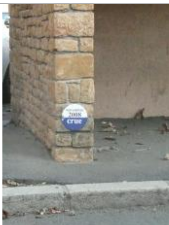
Photo du repère de crue

Altitude calculée de l'eau (en m) : 213.43