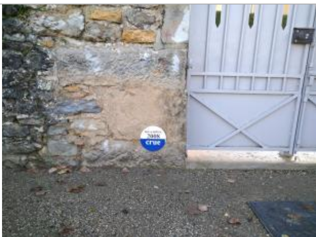
Photo du repère de crue

Altitude calculée de l'eau (en m) : 193.3