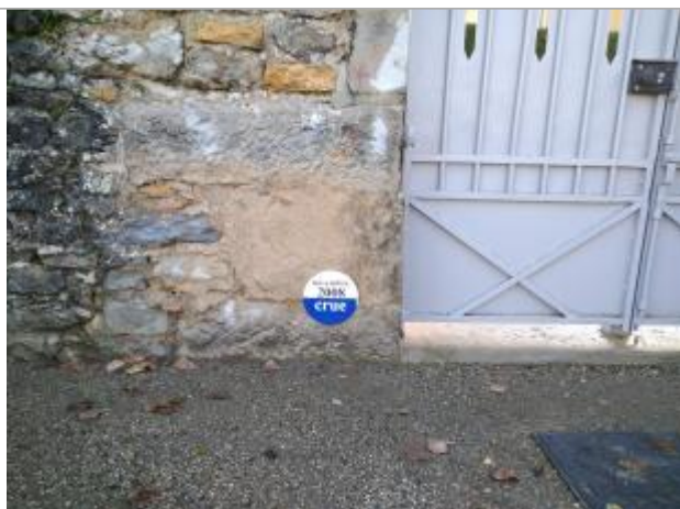
Photo du repère de crue