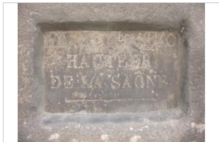
Photo du repère de crue

MARQUE Texte : Crue 5 obre 1840 Hauteur de la Saône Maximum de l'inondation : Non renseigné Visibilité : Oui