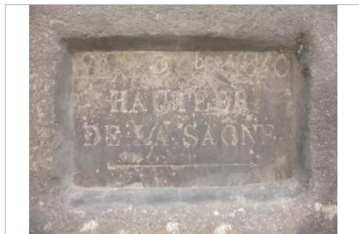
Photo du repère de crue