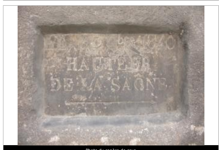
Photo du repère de crue

MARQUE Texte : Crue 5 obre 1840 Hauteur de la Saône Maximum de l'inondation : Non renseigné Visibilité : Oui