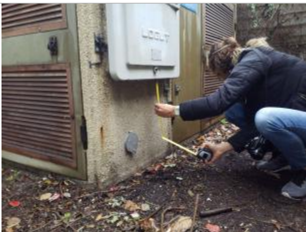
Vue de la PHE

Différence entre le niveau d'eau et la référence (en m) : 0.080 m