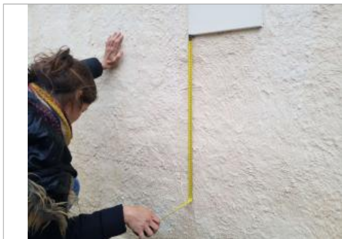
Vue de la PHE - Auteur : Cerema Méditerranée

Différence entre le niveau d'eau et la référence (en m) : -0.570 m