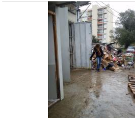
Vue du site - Auteur : Cerema Méditerranée