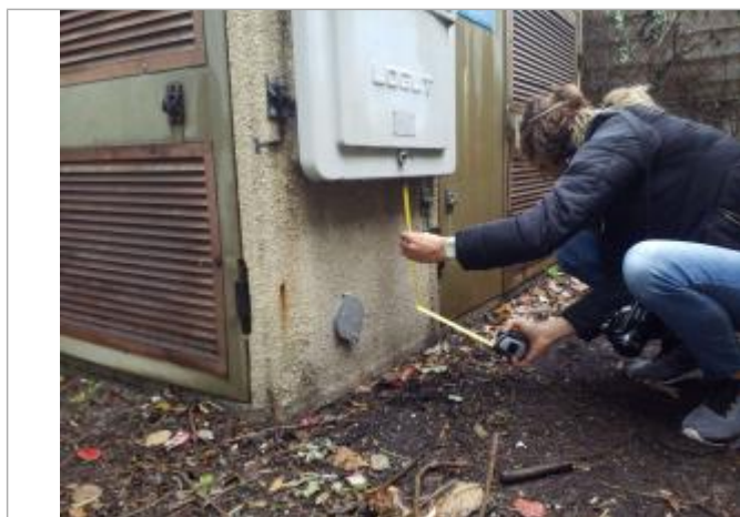
Vue de la PHE

Différence entre le niveau d'eau et la référence (en m) : 0.080 m