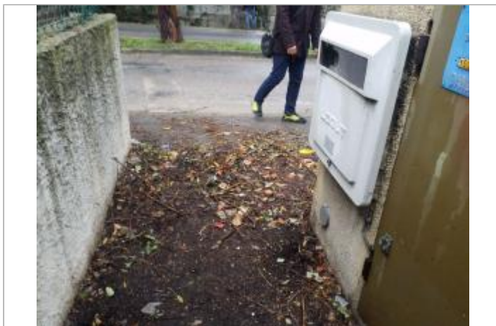
Vue du site - Auteur : Cerema Méditerranée