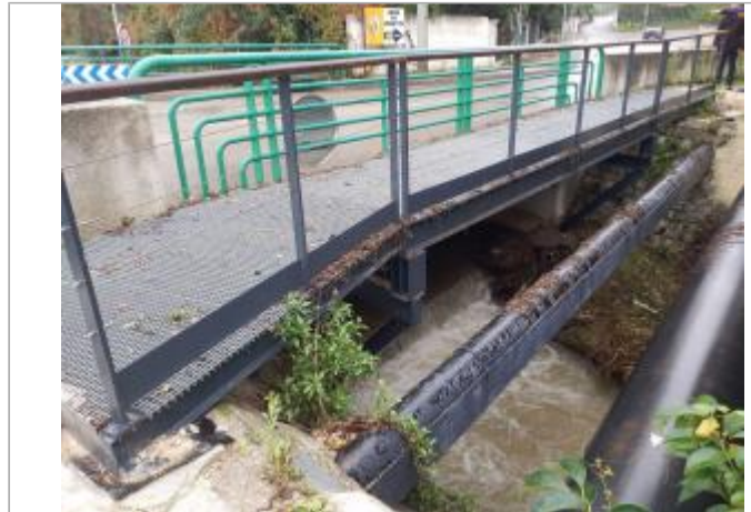
Vue du site - Auteur : Cerema Méditerranée