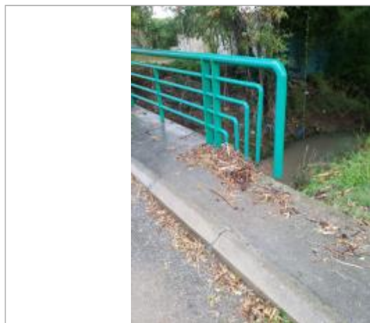
Vue de la PHE

Type de repérage : Campagne de terrain post-inondation Organisme : CEREMA Méditerranée