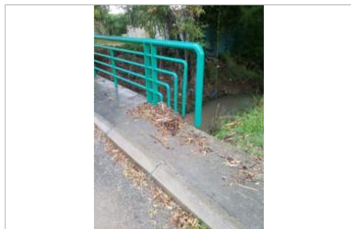
Vue de la PHE

GÉNÉRAL Code : CER_CAD19_R_06_1 Date de mise à jour : 10/12/2019 Auteur : Cerema Méditerranée