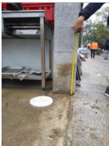
Vue de la PHE

Différence entre le niveau d'eau et la référence (en m) : 0.360 m