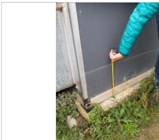
Vue de la PHE

Différence entre le niveau d'eau et la référence (en m) : 0.375 m