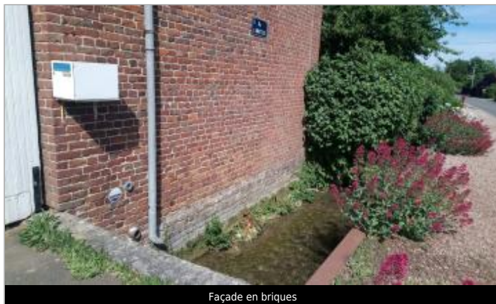
Façade en briques