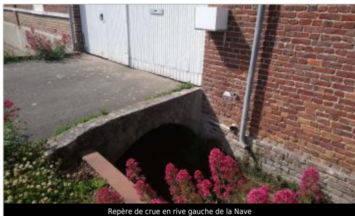
Repère de crue en rive gauche de la Nave