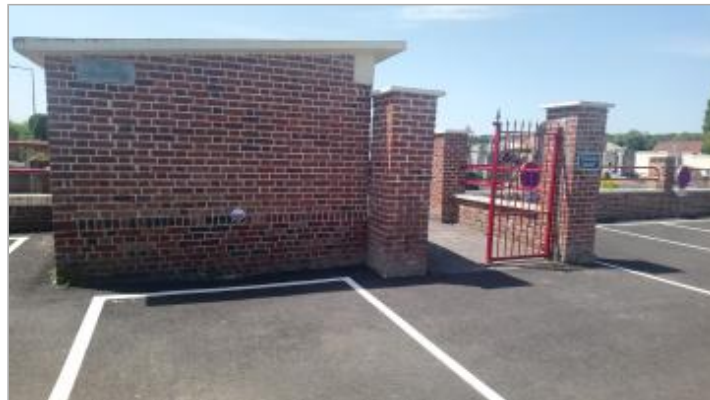
Façade en briques du cimetière