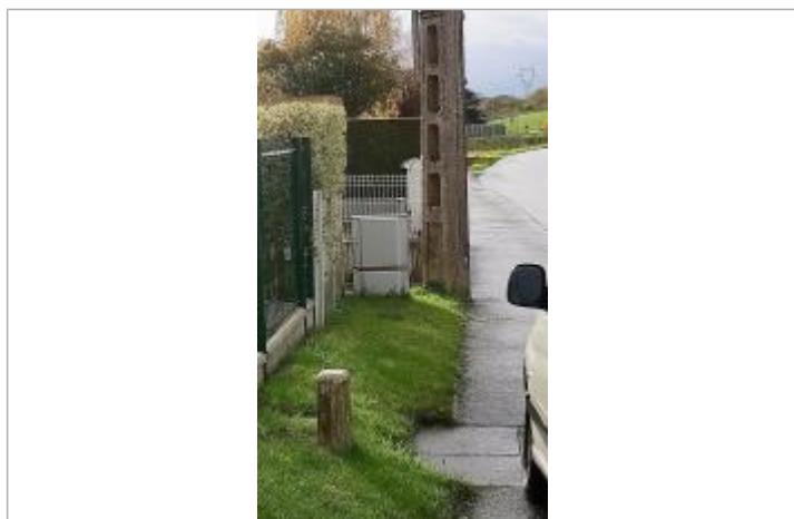
Repère de crue sur un poteau électrique