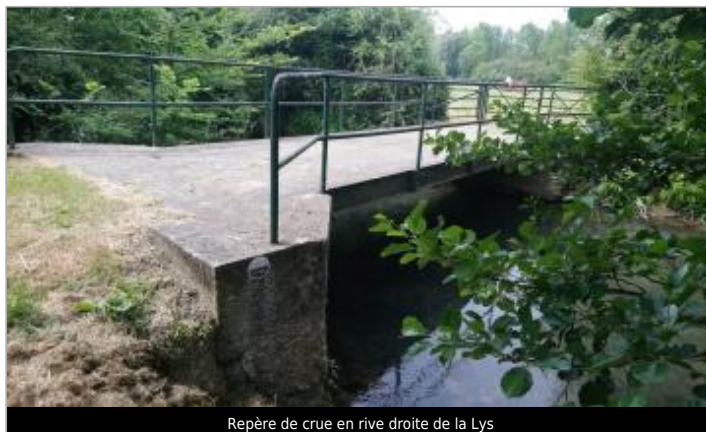
Repère de crue en rive droite de la Lys