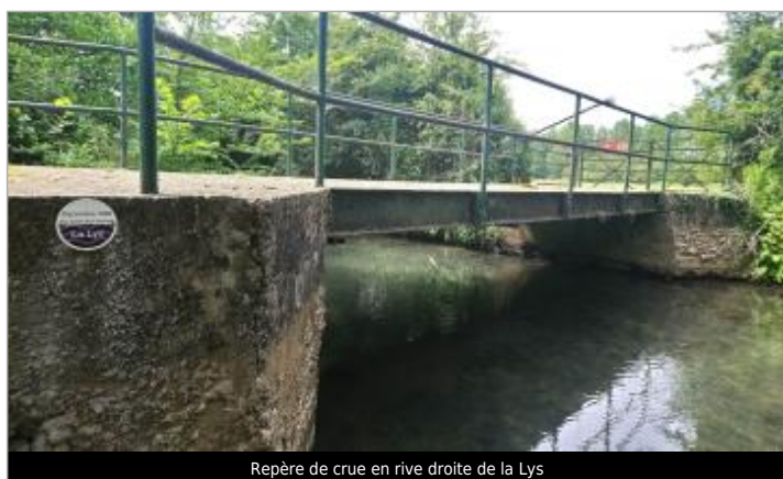
Repère de crue en rive droite de la Lys