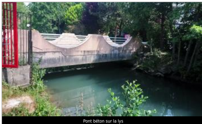
Pont béton sur la lys