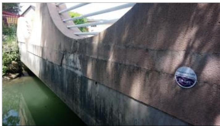
Repère de crue en rive droite de la Lys