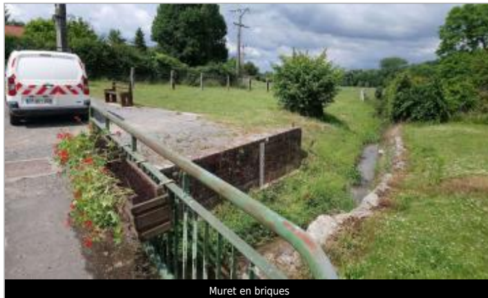
Muret en briques