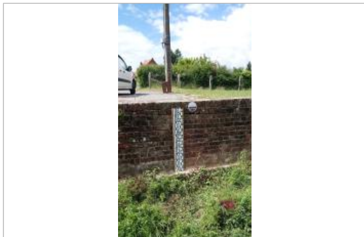
Repère de crue en rive gauche de la Lawe