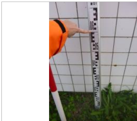
Berge rive gauche stade - Photo ©AGERIN

Coordonnées WGS84 : X: 2.31147603 / Y: 43.18946890