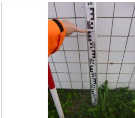
Berge rive gauche stade - Photo ©AGERIN

Altitude calculée de l'eau (en m) : 119.59 m