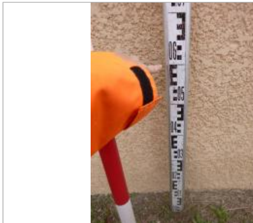
Berge rive gauche stade

Coordonnées WGS84 : X: 2.31206035 / Y: 43.19068920