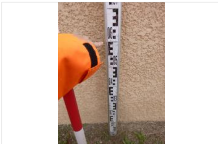
Berge rive gauche stade