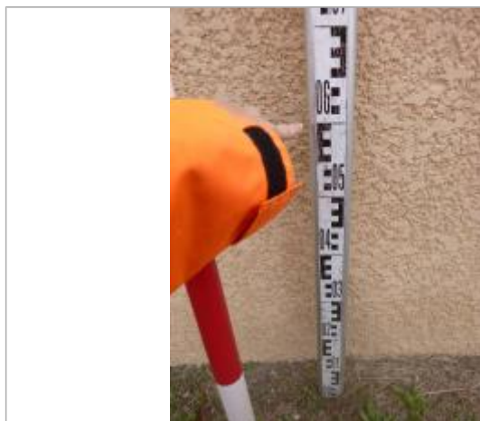
Berge rive gauche stade

Altitude calculée de l'eau (en m) : 119.55 m